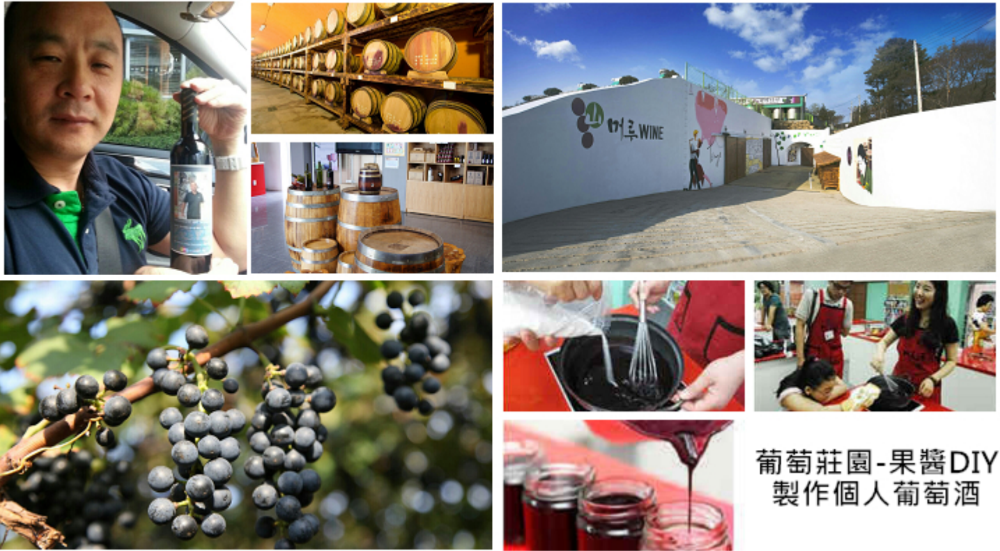
葡萄莊園-果醬DIY 製作個人葡萄酒

充滿歐洲風情的葡萄酒莊。體驗自製葡萄果醬，以及拍攝個人照片貼在酒瓶上，做出獨一無二的個人專屬紀念葡萄酒。