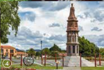
Images: 1. 愛哥頓農場Agrodome Farm, 2. 皇后鎮山頂纜車Skyline - Gondola 3. 蒸汽遊船TSS號Steamship TSS, 4. 羅吐魯阿Rotorua