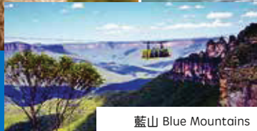
藍山 Blue Mountains

含澳洲境內機票 Incl. Internal flights 贈送SIM卡-無限澳洲境內通話(另含上網) BONUS: Unlimited Calls in AUS w/Data