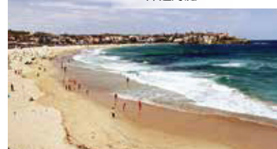
邦迪海灘 Bondi Beach