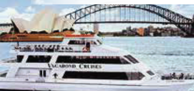
連令港遊船 Darling Harbour Cruise