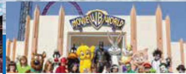
電影世界 Movie World